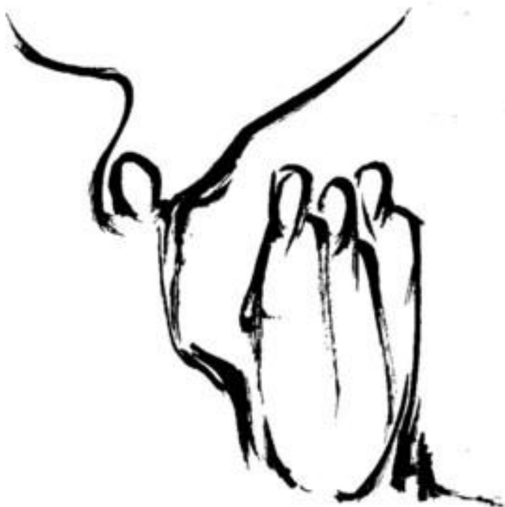
Der Engel am Grab (Joh. 20, 1-18)